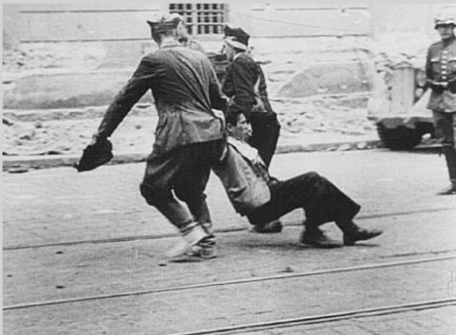
Німецький солдат спостерігає як українці тягнуть єврея вниз вулицею Львова. Липень 1941 р. Американський музей Голокосту.

[Електронний ресурс]. — Режим доступу: http://varjag-2007.livejournal.com/85416.html .