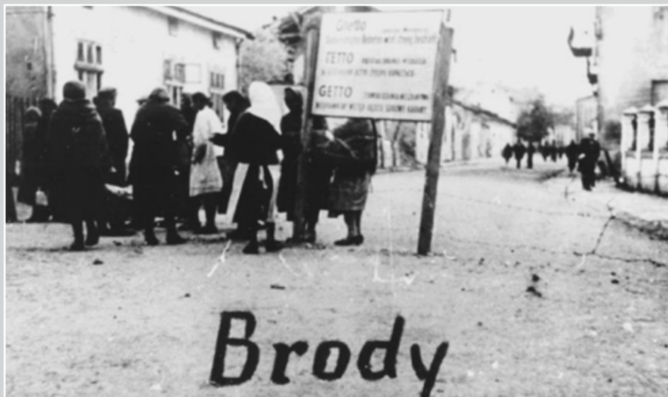
Гетто у м. Броди. 1942 р.

[Електронний ресурс]. — Режим доступу: http://www.google.com.ua/imgres?q=getto&hl=ru&client=firefox-a&sa=X&rls=org.mozilla:ru:official&channel=s&biw=931&bih=546&tbn=isch