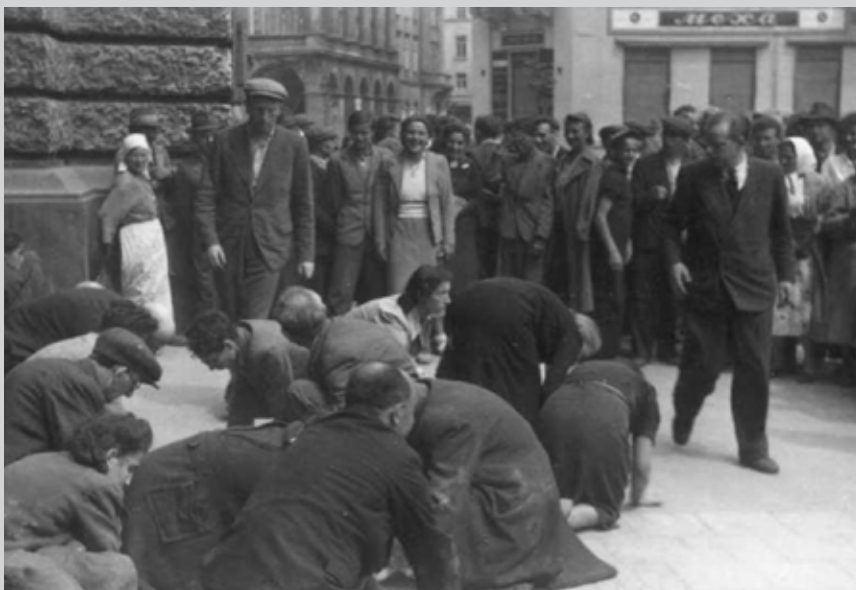
Львів. 1 липня 1941 року. Єврей змушують мити бруківку під наглядом місцевого населення.