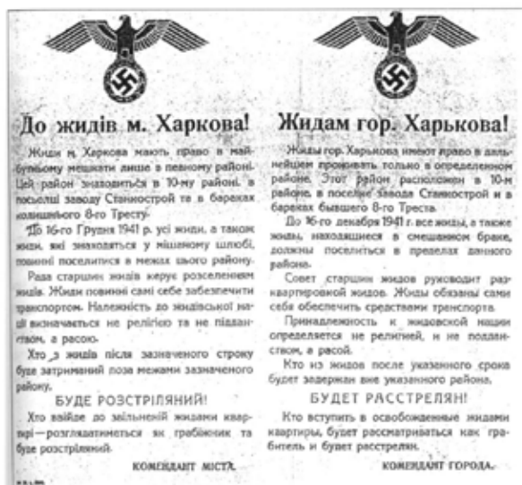
Наказ євреям Харкова. Грудень 1941 року

Назустріч пам'яті [Текст] : навч.-метод. посіб. до фільму про Голокост в Україні «Назви своє ім'я» / авт.-упорядн.: О. Войтенко, М. Тяглий. — К. : Оранта, 2007. — С. 103.