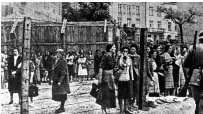
Львівське гетто. 1941 р.

[Електронний ресурс]. — Режим доступу: http://panzer-travelandhistory.blogspot.com/2010/07/blog-post_02.html