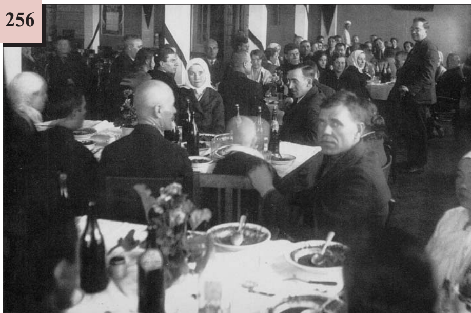
Святковий обід ударників заводу ім. Петровського. Дніпропетровськ, 1936 р.