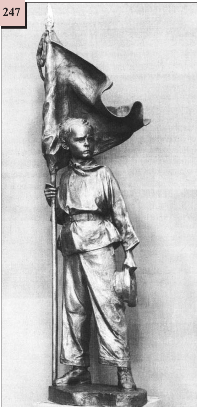
Скульптура Павлика Морозова