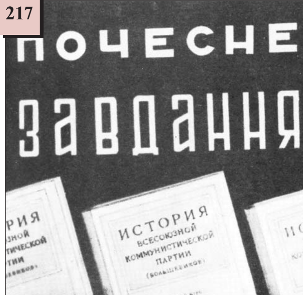
«Почесне завдання» – про видрук «Історії ВКП(б)» 1939 р. за редакцією Сталіна.

Шкварчук В. На казарменому становищі. – Чернігів, 2002. – С. 130.