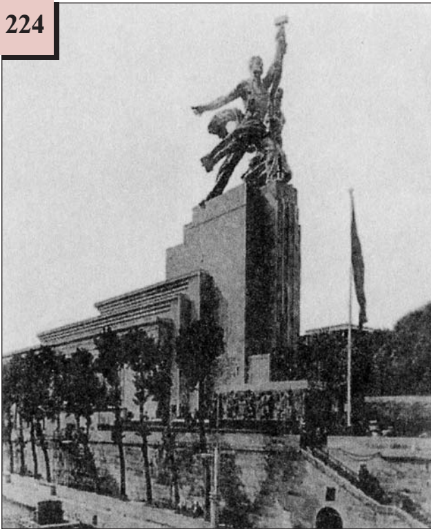
Фото радянського павільйону на Всесвітній виставці у Парижі, 1937 р.