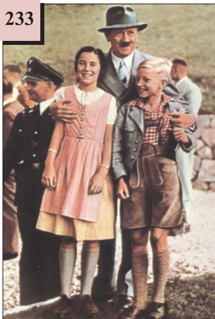
Гітлер і діти