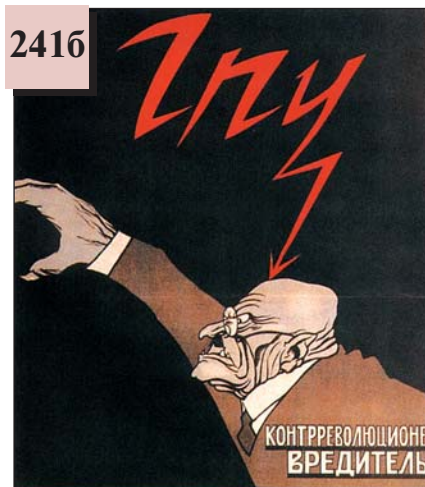
Радянський плакат «Революційна блискавка». 1934 р.

Синявський А.Д. Основы советской цивилизации. – С. 295–297.