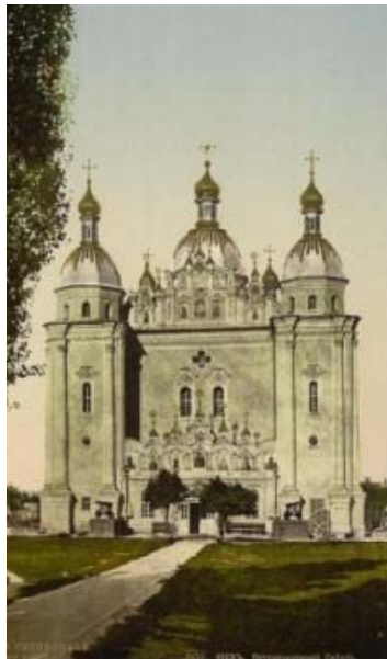
Собор Св. Миколая, 1696 р., підірваний у 1930-х рр.

Київ: Фотоальбом. / Вступ ст. В. Кузменка; Упоряд. А. Прибега. — К.: Мистецтво, 2005. — С. 97.