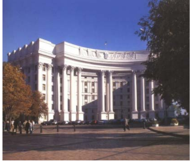
Будинок МЗС України, побудований на місці Трьохсвятительської церкви.

Старий Київ. Фотоальбом. — К.: Видавець Ашот Арутюнян, Видавничий дім «Перископ», 2005. — С. 35.