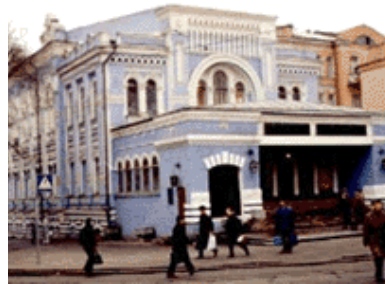
Театр ляльок у приміщенні синагоги, 1970 р.

Старий Київ. Фотоальбом. — К.: Видавець Ашот Арутюнян, Видавничий дім «Перископ», 2005. — С. 72.