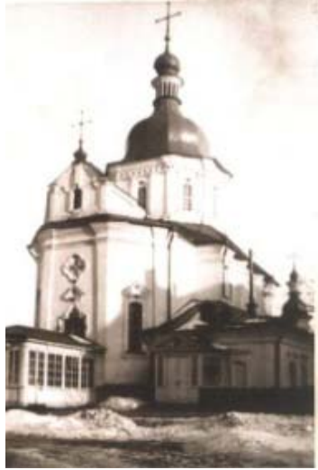
Трьохсвятительська церква, підірвана у 1930-х рр. м. Київ, Фото 1911 р.

Старий Київ. Фотоальбом. — К.: Видавець Ашот Арутюнян, Видавничий дім «Перископ», 2005. — С. 35.