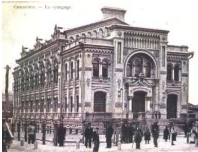
Хоральна синагога Л. Бродського, 1897 р. Листівка Д. Маркова, 1900 р.

Старий Київ. Фотоальбом. — К.: Видавець Ашот Арутюнян, Видавничий дім «Перископ», 2005. — С. 72.