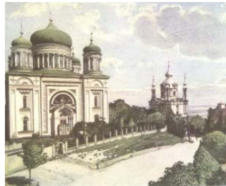
Десятинна церква у Києві, 1914 р.

[Електронний ресурс]. — Режим доступу: http://aratta-ukraine.com/text_ua.php?id=2004 .