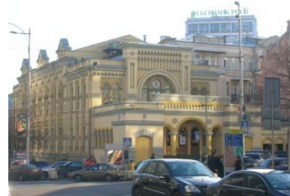
Хоральна синагога, вул. Ш. Руставелі.

[Електронний ресурс]. — Режим доступу: www.test.ukrainec.org .