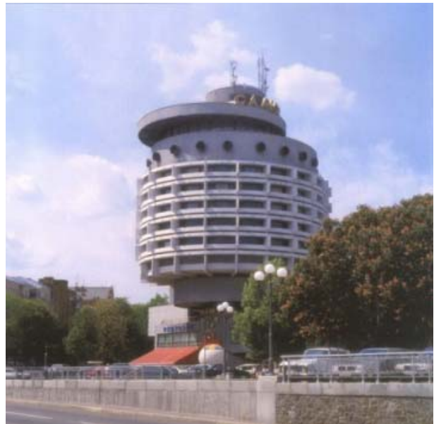
Готель «Салют», побудований на місці знищеного собору Св. Миколая.

Київ: Фотоальбом. / Вступ ст. В. Кузменка; Упоряд. А. Прибега. — К.: Мистецтво, 2005. — С. 161.