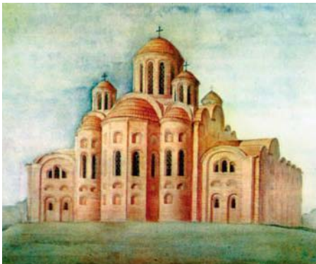
Реконструкція вигляду Десятинної церкви.

Вигляд Десятинної церкви у Києві у Х ст., її залишки у XVII ст. та відтворений вигляд на початку ХХ ст.