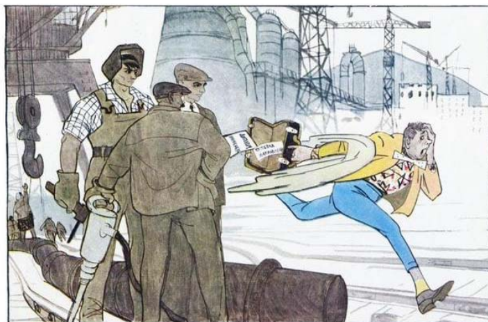
Підпис: «Тікав стиляга з Сахаліну».

Малюнок [Електронний ресурс]. — Режим доступу: http://igorserko.livejournal.com/566904.htm .