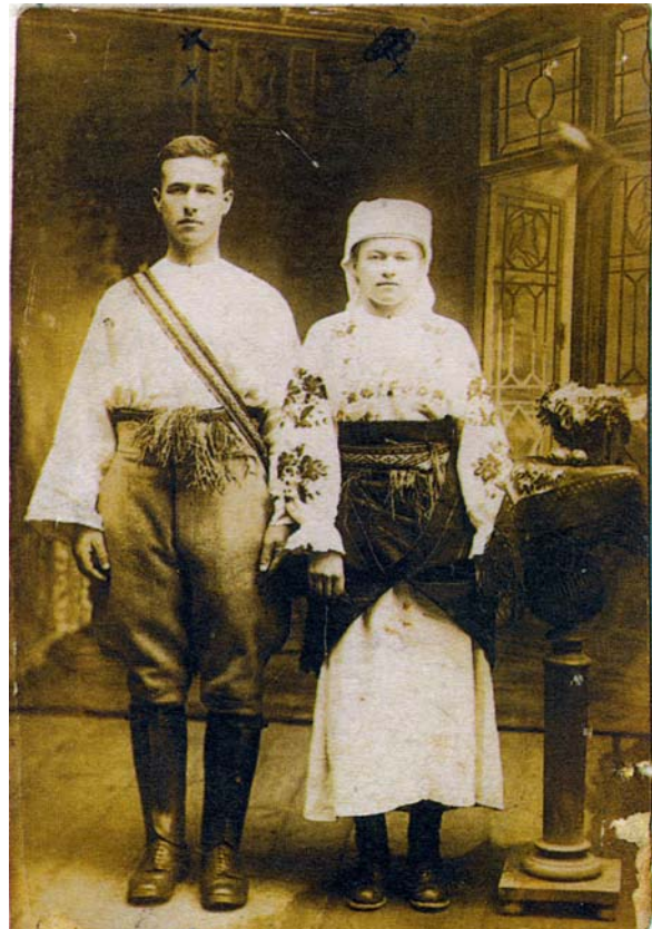
Буковина, 1930 р.