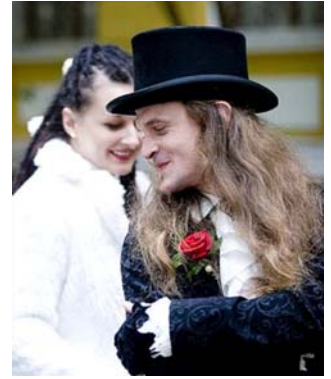
Чорний — колір готичного весілля [Електронний ресурс]. — Режим доступу: http://paramoloda.ua/blog/main/Chornyiy--kolir-gotychnogo-vesillya/ .