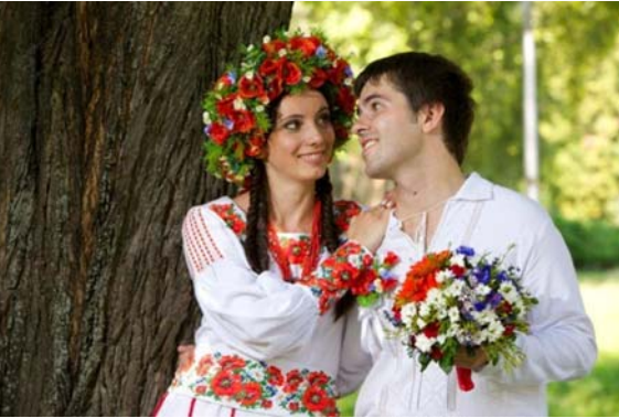
Українське весілля. м. Тернопіль, 2012 р.