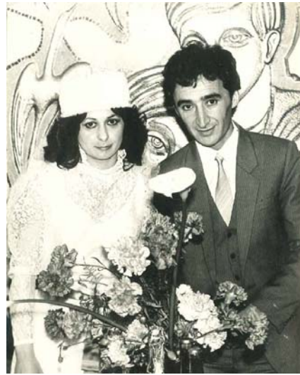
З родинного архіву Годжаєвих (Баку, Азербайджанська РСР, 1985 р.)