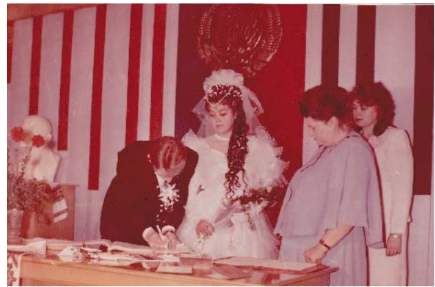
З родинного архіву Маркусів, 1990 р.