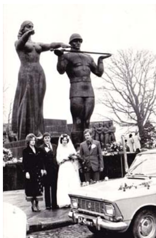
З родинного архіву Голосових, 1978 р.