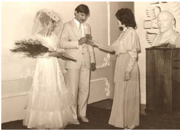
1989 р.