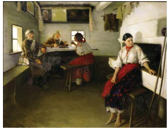
Пимоненко М. Свати. Поч. ХХ ст.