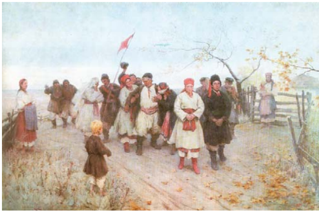
Пимоненко М. Весілля в Київській губернії. Поч. ХХ ст.