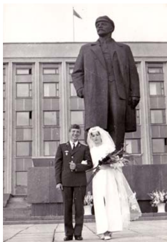
З родинного архіву Овсієнків, 1973 р.