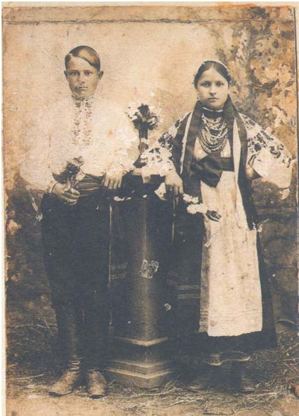
Київщина, 1916 р.