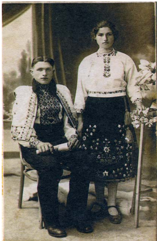
Львівщина, 1938 р.