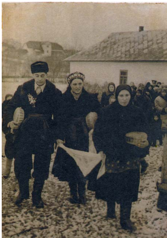
Вінничина, 1961 р.